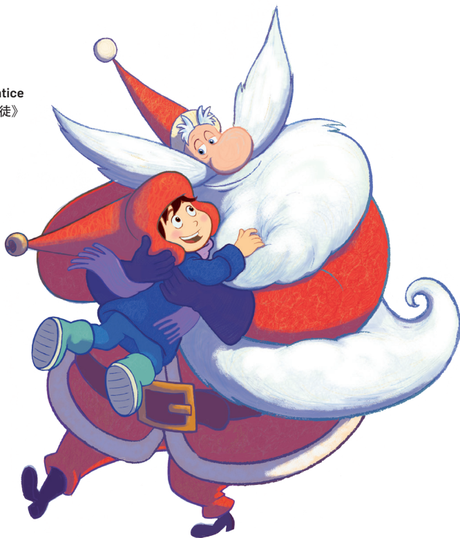
Santa's Apprentice 《圣诞老人的学徒》

(David Wenham) 主演的《橙子和阳光》；由简·坎皮恩 (Jane Campion) 导演的《明亮的星》；由阿娇·阿姆斯特朗导演, 盖伊·皮尔斯主演的《魔幻奇缘》；以及由斯科特·希克斯 (Scott Hicks) 导演, 克莱夫·欧文 (Clive Owen) 主演《男孩们回来了》等。