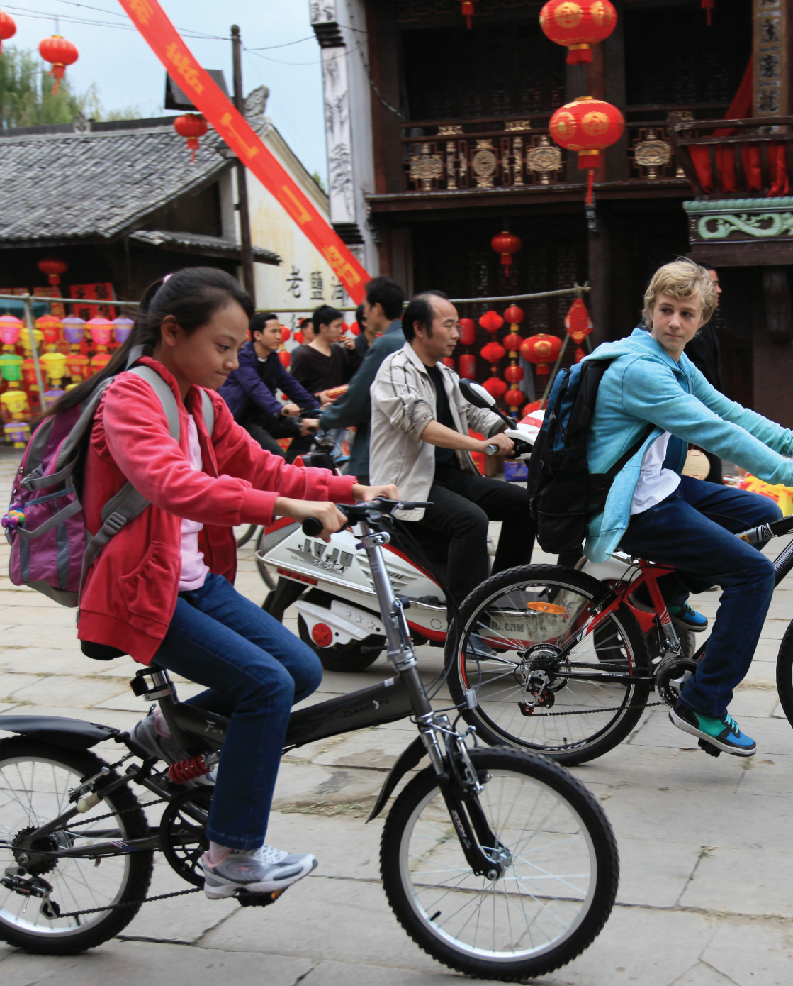
The Dragon Pearl 《寻龙探宝》